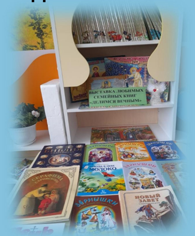
Выставка любимых семейных книг