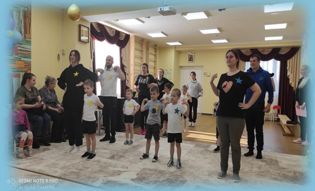
Спортивная эстафета: «Мы наследники Победы»