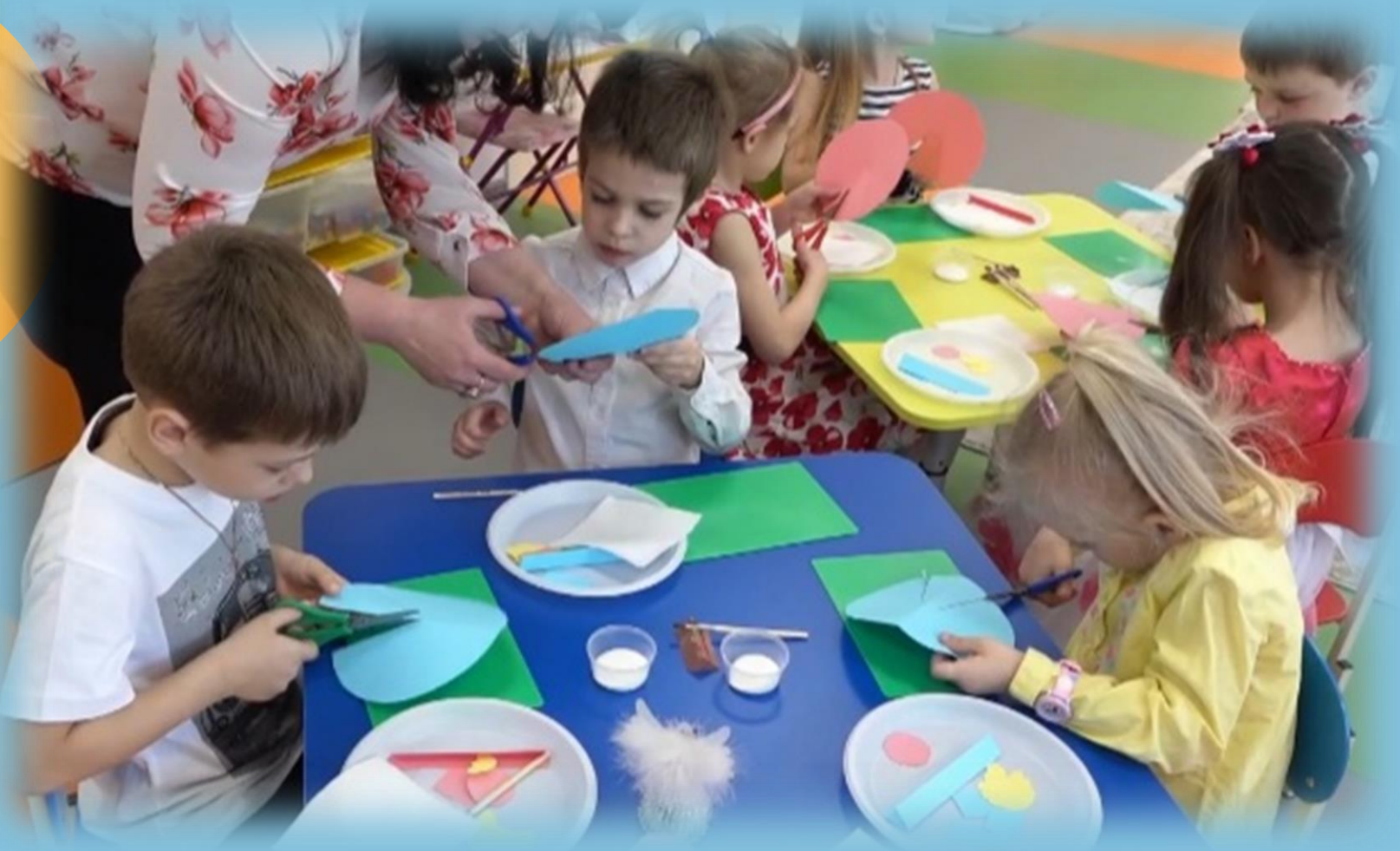
Подготовка к празднику «Святая Троица»