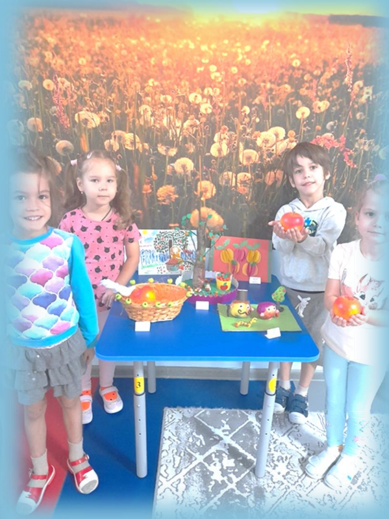
«Яблочный Спас» Выставка поделок из яблок