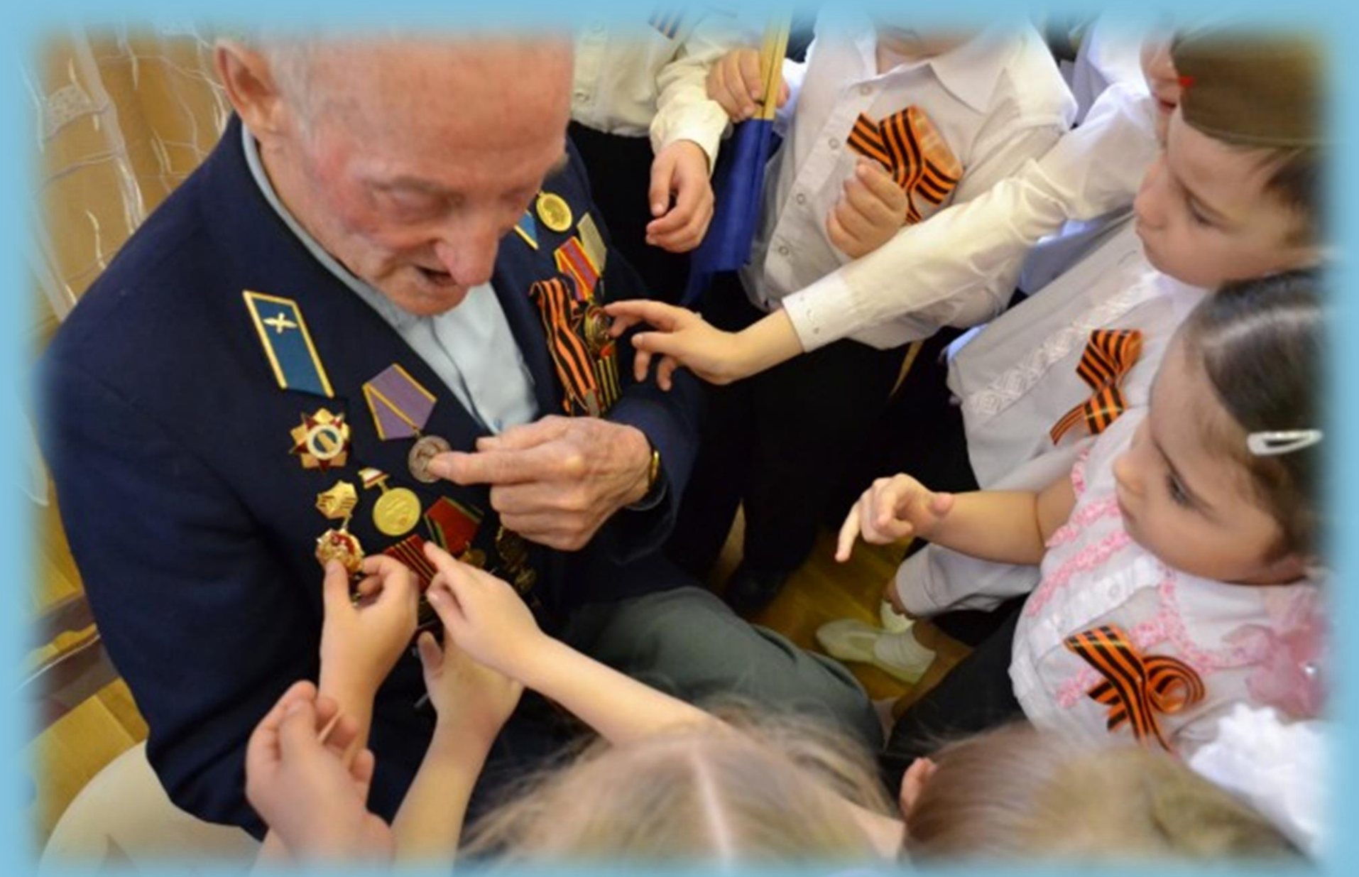
Встреча с ветераном ВОВ «Горжусь своим дедом»