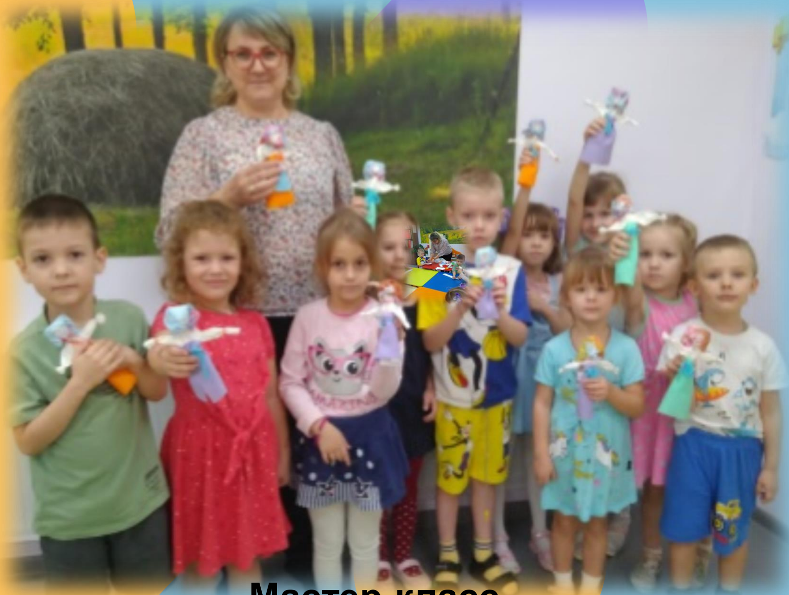
Мастер-класс «Народная тряпичная кукла»