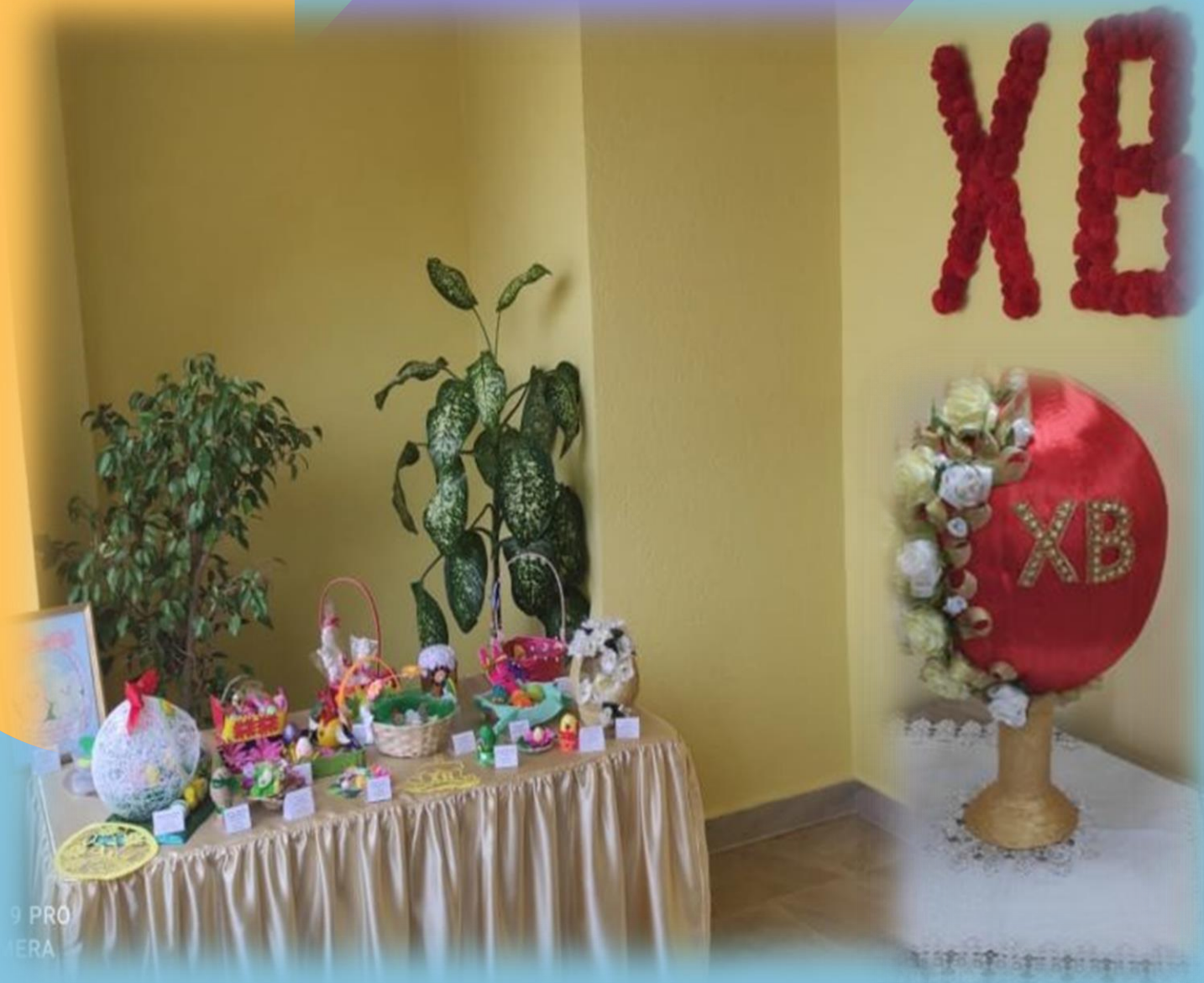
Выставка-ярмарка пасхальных поделок