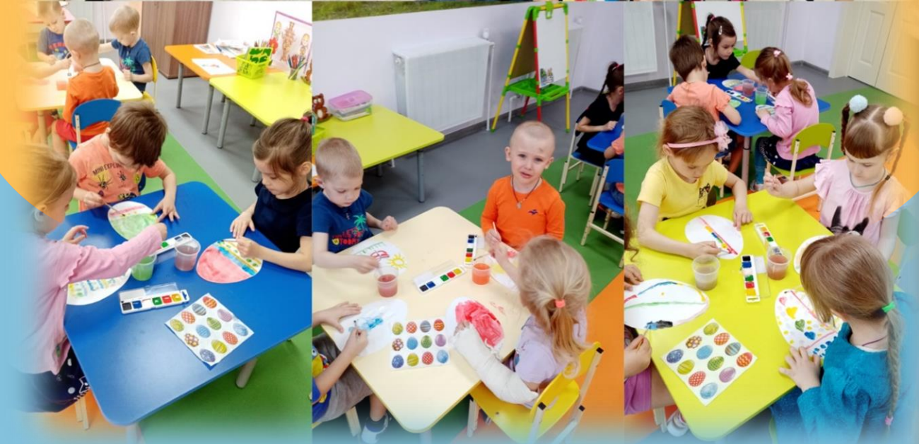
Подготовка к Великой Пасхе